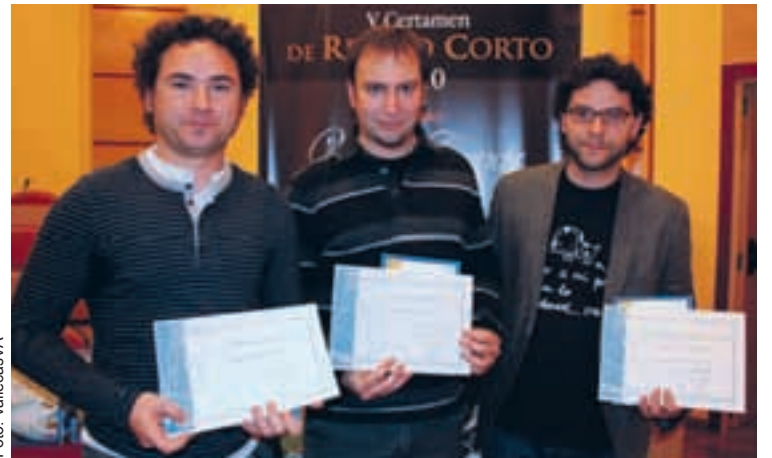
El ganador del certamen —en el centro— junto a los accésitarios.