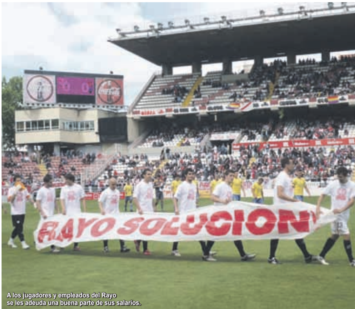
A los jugadores y empleados del Rayo se les adeuda una buena parte de sus salarios.