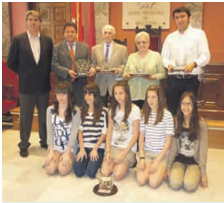
Los premiados, con Ángel Garrido, en la Junta Municipal del Puente de Vallecas.