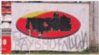
No se molestaron en dejarlo bonito.