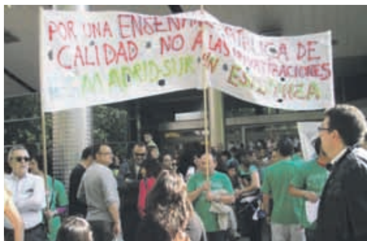
Concentración frente a la Asamblea, el 27 de Abril.

Campamento Urbano A.D. Madrid Sur Del 27 de junio al 15 de julio. Edad: de 6 a 12 años. C/ Javier de Miguel 92, bloque 2. Teléfono: 91 785 49 30 agrupacion@admadrissur.org