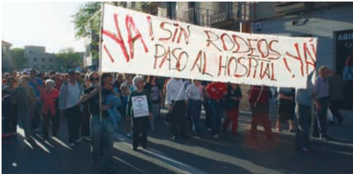
Los vecinos marcharon por Villa de Vallecas reivindicando un mejor acceso al Hospital.

Seguirán con las protestas hasta que se cumpla lo prometido