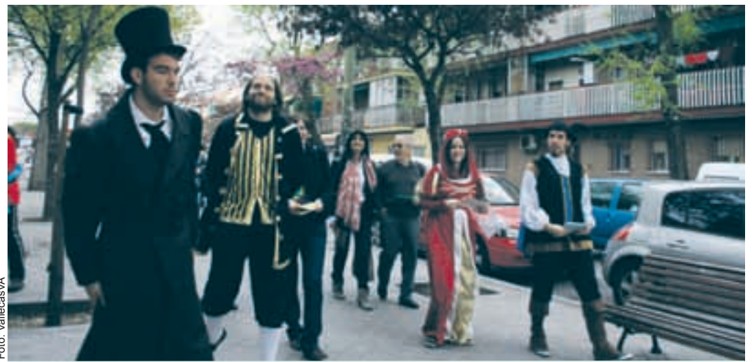
Personajes de Andersen en pasacalle por Vallecas, tras su llegada desde la estación de Sierra de Guadalupe.

A pesar de no contar con ayuda de las entidades oficiales, tal como sucedía en años anteriores, la XII edición de Vallecas Calle del Libro logró congregarse a los vecinos, tanto jóvenes y adultos, quienes se dejaron embujar por este festival de las letras, todo un clásico en el distrito.