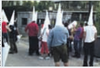
¡Qué gente tan maja! El Rayo y a las procesiones, sus dos pasiones...

Entre las actividades organizadas por los aficionados del Rayo para protestar por la situación de la entidad, hubo un "regalo" especial para la familia Ruiz-Mateos. Concedores de su admiración por los actos religiosos, varios aficionados rayistas, ataviados con la tradicional indumentaria de nazareno, se pre-