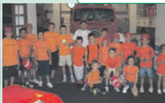
La visita a la base aérea de Torrejón, donde pudieron subir a la cabina del F-18, y el Museo de Bomberos, fueron algunas de las actividades que más atrajeron a los niños en la anterior edición del Campamento Urbano Madrid Sur.