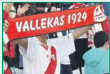
La afición se merece un homenaje por parte de los jugadores del Rayo Vallecano.

Para ello, pretendemos que el Club (jugadores del primer equipo, cuerpo técnico y cantera) dedique unas horas a estar con todos aquellos que tanto han contribuido en la lucha por intentar hacer realidad el sueño de volver de nuevo a Primera División. La jornada podría celebrarse un domingo (una buena fecha sería tras el partido en Vallecas frente al Xerez, en el fin de semana del 21 y 22 de mayo). Ahí dejamos la idea, de otros depende que finalmente pueda o no llevarse a cabo.